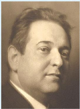
E. W. Korngold Märchenbilder