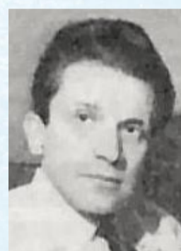
M. Weinberg Sinfonietta