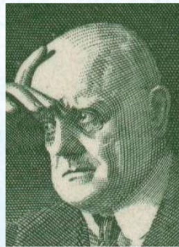
J. Sibelius Finlandia